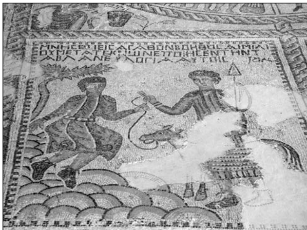
Ákédát Jichák. Cipori, VI. sz.

Cipori egyébként az a hely, ahol rabbi Juda Hánászi – a zsidó hagyomány szerint – kodifikálta a Misnát. Az archeológiai kutatás két vezetője munkájának Az Ígéret és a Megváltás héber címet adta. Nem véletlenül, hiszen a Cipori mozaikok ikonográfiájára jelentős mértékben hatott az adott kor ideológiája és egyre erősödő világszemlélete, s mindenek előtt az ősi hit és az azonosságtudat: „a Templom helyreállításába vetett remény vizuális megjelenítéseként ábrázolták őket”. 10